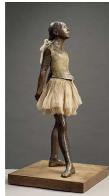
Petite Danseuse de 14 ans ou La Grande danseuse (1879-1881)